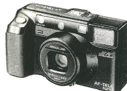
Minolta har lavet det hidtil mest automatiske lommekamera. Til gengæld må man undvære zoom.