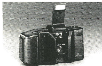
Kodaks nye topmodel hedder »S1100XL«. Takket være den usædvanlige blitz undgås alle problemer med røde øjne på billederne.

Kodak S-1100XL udmærker sig desuden ved en autofokus med ikke